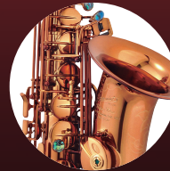
コニャックラッカー