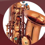
コニャックラッカー