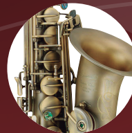
ダークヴィンテージ