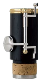
Low B b エクステンション (別売)