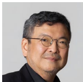
NHK交響楽団首席 青山 聖樹

厳選した最高級の木材を使用しており、管体に触れる部分をすべて金メッキにすることで、音がより遠くまで響き渡ります。特に高音域の柔軟性が高く、とても柔らかく楽な吹奏感が人気のモデルです。