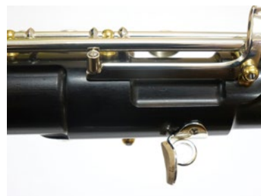
重量を軽くしている管体