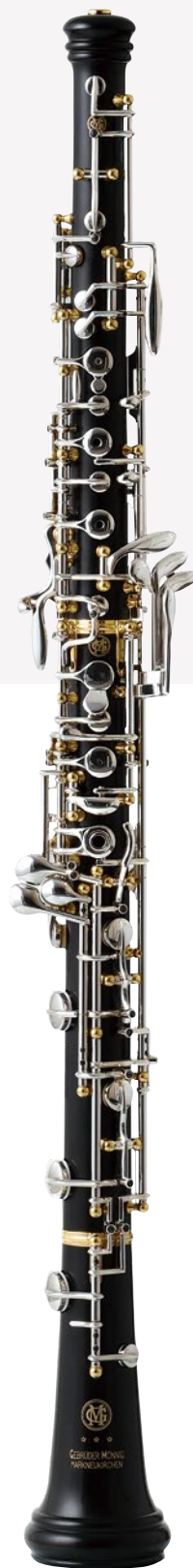
155AM Satoki Style