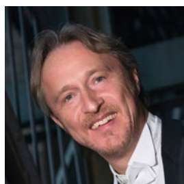
ベルリン・フィルハーモニー 管弦楽団首席 アルブレヒト・マイヤー